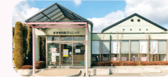
すずき内科クリニック

当院の得意としているところとして 喘息・アレルギーと漢方診療 があります。 アレルギー症状や長引く咳でお困りの方、また漢方診療に興味がある方はご相談下さい。